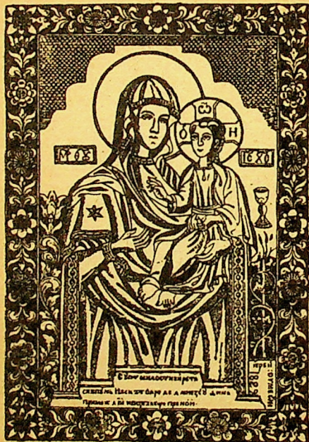
Bucură-te, Marie, Maica Dumnezeului celui viu.