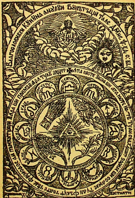
Blagoslovi-vei cununa anului bunătății Tale.