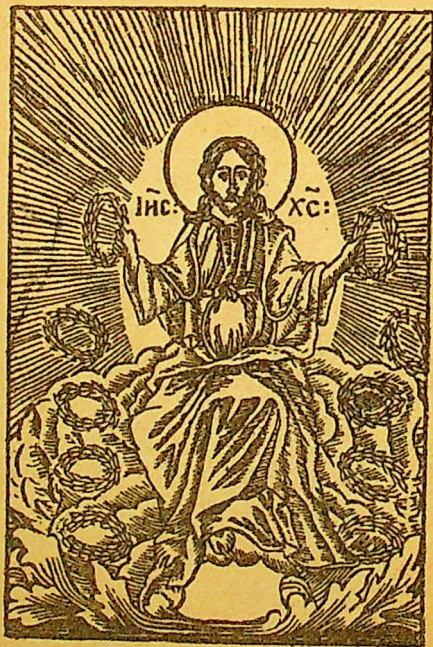
Iisuse, Fiul lui Dumnezeu, miluește-mă.